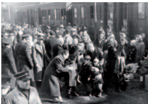
Nella foto: Esodo giuliano-dalmata a Torino, da Storia di un esodo. Istria 1945-1956 Ed. Istituto regionale per la storia del movimento di liberazione in Friuli Venezia-Giulia, Trieste 1980

Il Parlamento italiano riconosce il 10 febbraio quale "Giorno del Ricordo" in memoria delle vittime delle foibe, dell'esodo giuliano-dalmata, delle vicende del confine orientale.